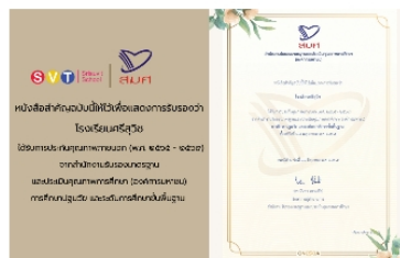
รับรองการประกันคุณภาพภายนอก (พ.ศ. ๒๕๖๔ - ๒๕๖๕)