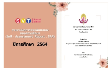
รายงานผลการประเมินตนเองของสถานศึกษา (Self - Assessment Report : SAR) ปีการศึกษา 2564