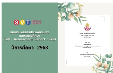
รายงานผลการประเมินตนเองของสถานศึกษา (Self - Assessment Report : SAR) ปีการศึกษา 2563